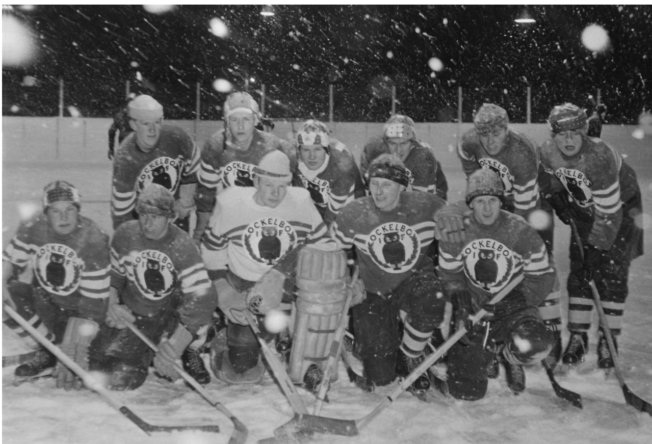
Lingbo IF:s första hockeylag. OBS! De lånade tröjorna från Ockelbo.